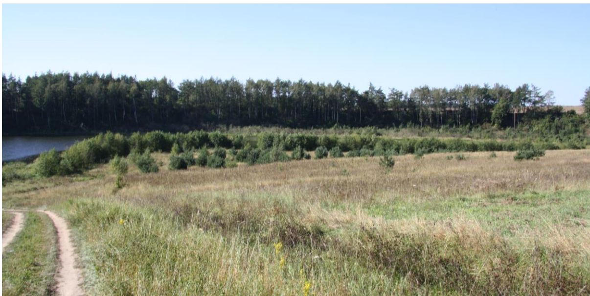
Zdj. 1 Widok od strony drogi dojazdowej na teren objęty zakresem opracowania

Mając na uwadze istniejące zagospodarowanie w przedstawionych lokalizacjach, ingerencja w środowisko naturalne nie przekroczy aktualnych norm. Realizacja przedmiotowej inwestycji nie wymaga wycinki drzewostanu na analizowanych działkach lokalizacyjnych.