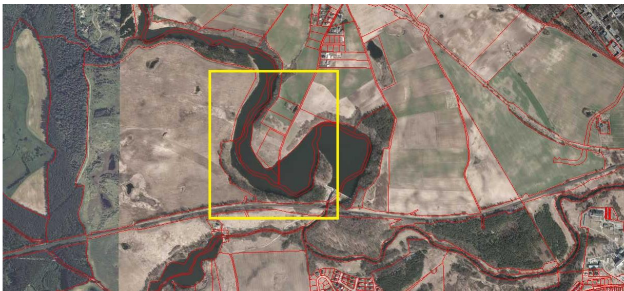
Rys 1.3 Mapa sytuacyjna określająca położenie inwestycji w- Żabnie na tle istniejącej struktury własnościowej

Działki 56, 51/4, 51/5 i 51/9 położone są w miejscowości Żabno, nad rozlewiskiem, będącym skutkiem budowy elektrowni wodnej Wierzyca. Dostępność transportowa lokalizacji jest utrudniona, ze względu na zły stan nawierzchni drogi dojazdowej oraz znaczne spadki terenu w kierunku rozlewiska.